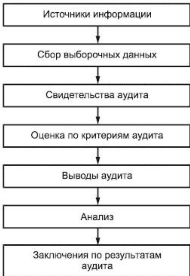
Рисунок 3 - Блок-схема процесса, начиная от сбора информации до получения заключений по результатам аудита