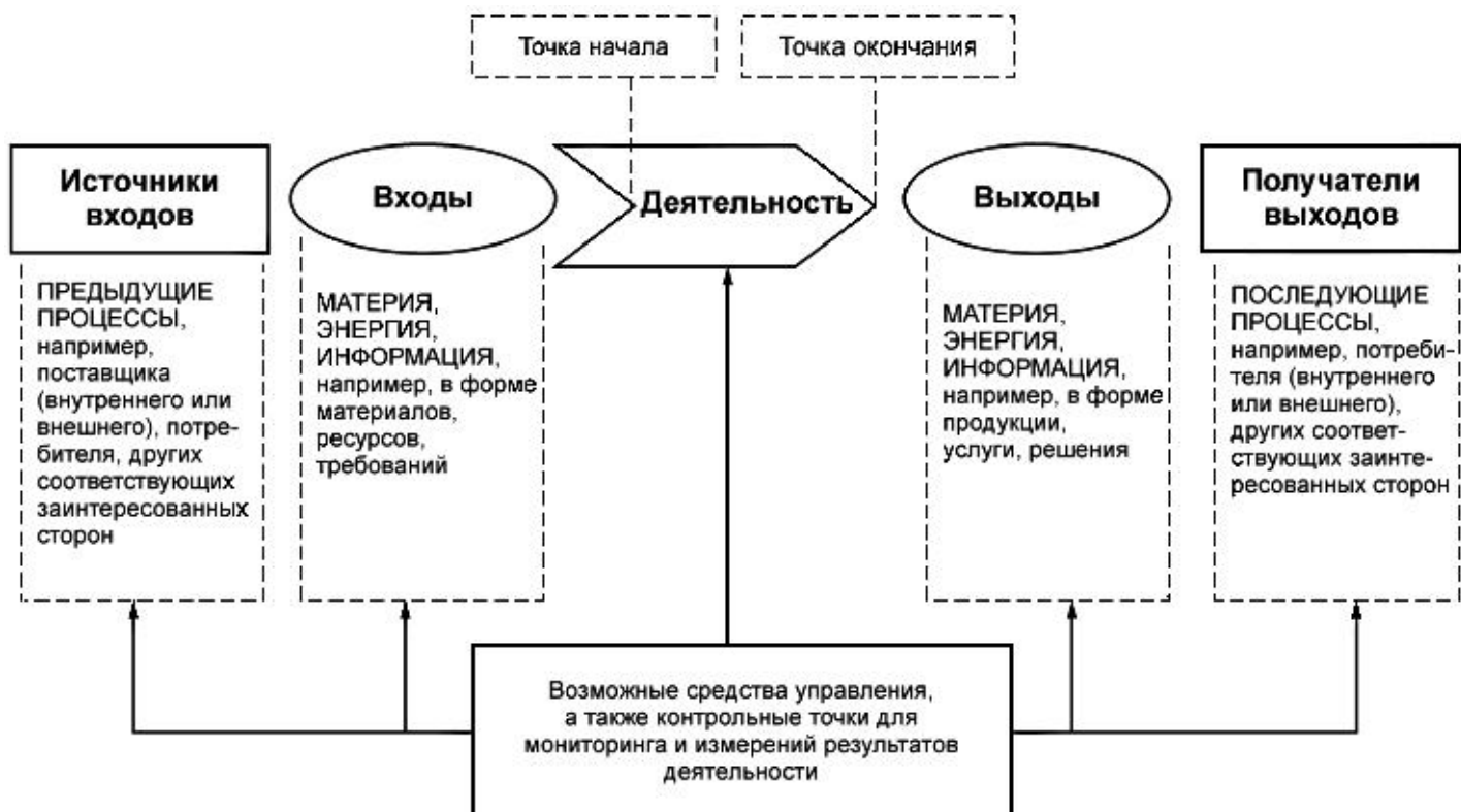
Рисунок 1 - Схематическое изображение элементов процесса